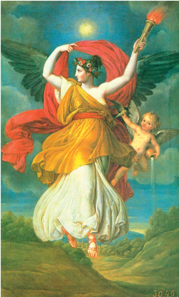
"La Aurora". Museo del Prado.