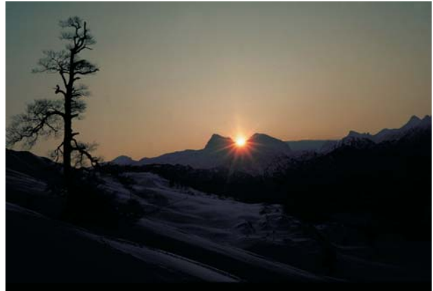
"Amanecer en Larra".