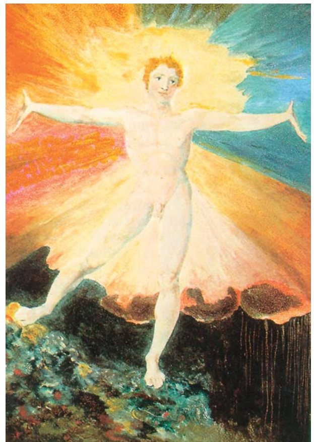
"Día radiante". Blake