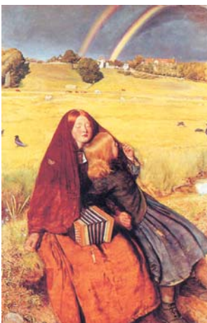
"La joven ciega". John Everett Millais.