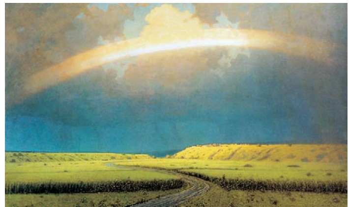
"Arco iris". Arjip Kuindzhi. Museo Ruso.