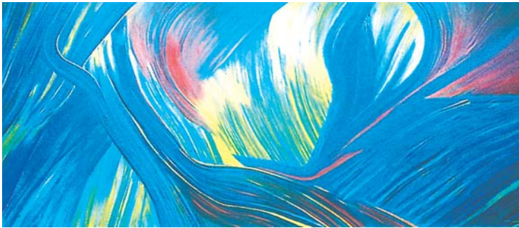
"Goiz Argia". José Antonio Sistiaga.