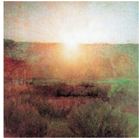
"El sol". Giuseppe Pellizza da Volpedo.