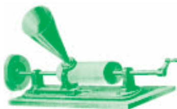
Primer fonógrafo de Edison.