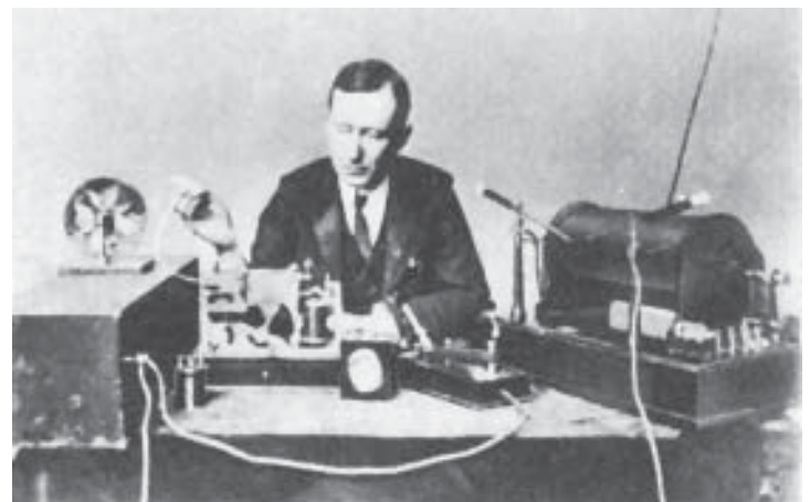
Guillermo Marconi establece un hito en la telegrafía sin hilos cuando, en 1901, transmite en lenguaje morse, un mensaje a través del Atlántico, desde Cornwall a Terranova.

Esa combinación de voces, melodías, efectos sonoros, discursos e interpretaciones, elaborada con el arte de la palabra y la artesanía de la ambientación musical, constituían, a comienzos del siglo XXI, un elemento más del entorno sonoro de la vida cotidiana para algo más de millón y medio de ciudadanos vascos que,