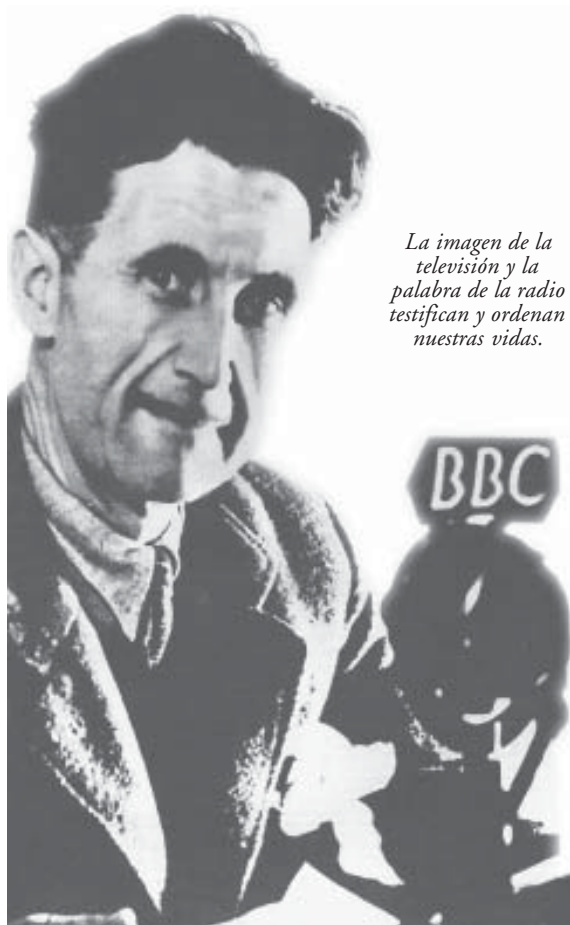
La imagen de la televisión y la palabra de la radio testifican y ordenan nuestras vidas.

Por otra parte, la incorporación de la radio a la red de redes, a Internet, desde finales del siglo XX, posibilitando así la difusión por cable de contenidos típicamente radiofónicos en conjunción con otros de carácter multimedia, sugirieron el concepto de radio a la carta. Una nueva opción de acceso a contenidos radiofónicos que, acompañada de una decidida actuación de los poderes públicos a favor de la incorporación de la sociedad a la Red, a Internet, obligó a los gestores y programadores de radio a plantear nuevos contenidos de comunicación para un nuevo mercado de usuarios y clientes más habituados al intercambio electrónico.