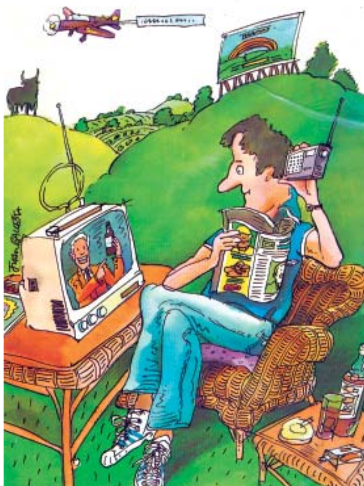
La radio y la televisión portátiles convierten en un espacio doméstico cualquier lugar de la naturaleza, que está ya señalizada por cielo y tierra con iconos de publicidad. En la viñeta, el individuo solitario, aislado, pero acosado por la oferta y solicitud publicitaria.

Para muchos ha constituido y seguirá constituyendo, si no la única, una de las maneras más importantes y accesibles de aprehender muchos matices del complejo entorno vital que nos rodea y que la radio ha sabido liberar de todo tipo de fronteras. Es la radio que nos despierta, nos propone los temas informativos del día y los motivos de conversación en el ascensor o la oficina, nos alegra la existencia en claves de humor, nos ayuda a reflexionar, nos obliga a tararear las melodías de moda, nos llama la atención sobre el estado de nuestra salud o nos recuerda que lo